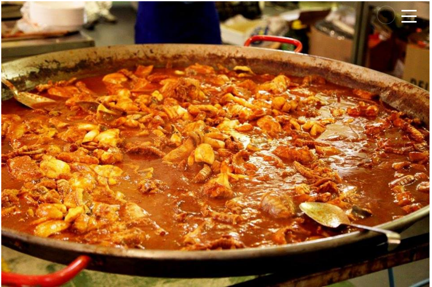
A Fano Festival Internazionale del Brodetto e delle Zuppe di Pesce (/04-07-2018/fano-festival-internazionale-del-brodetto-e-delle-zuppe-di-pesce)